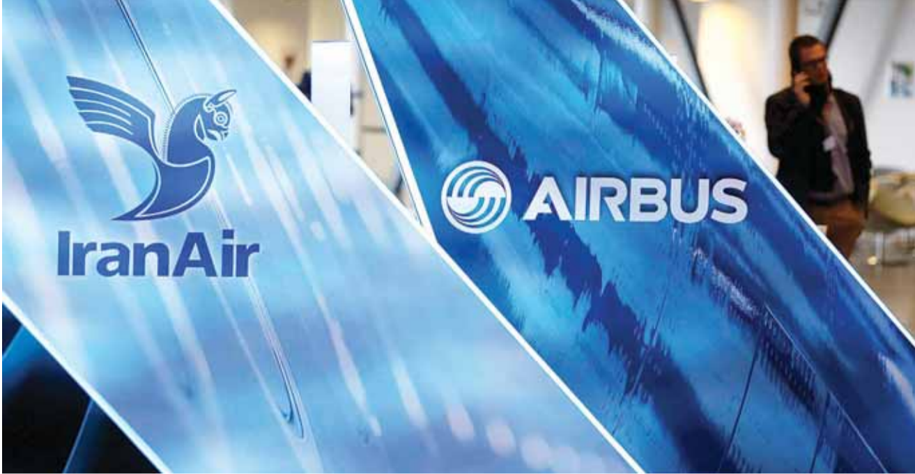
هل تلغى «أيرباس» صفقة بيع طائرات إلى طهران؟ | رويترز

ونقلت وكالة الإعلام الروسية عن مسؤول في وزارة الخارجية الروسية قوله إن وزير الخارجية