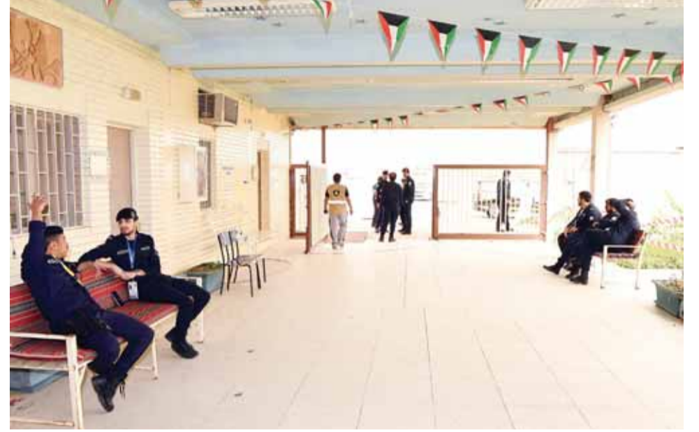
حضرت الشرطة وغاب الناخبون