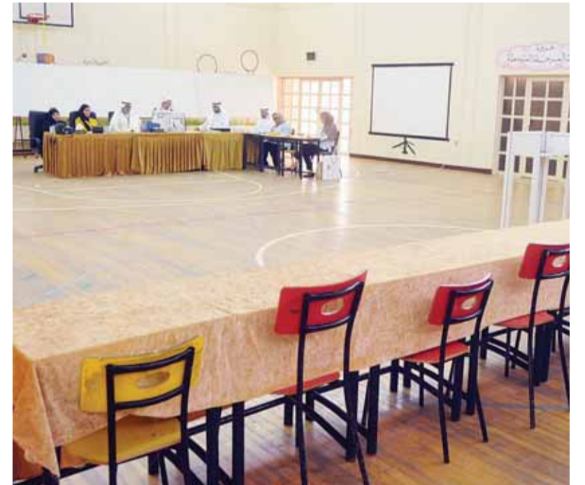
لجنة خالية من المندوبين في الدائرة الأولى

وقال صفر لـ «القبس»: خلال معاصرتي المجلس البلدي ومجلس الأمة، علمت بأن المجلس البلدي هو المجلس الأكثر إنتاجاً وبحثاً عن القرارات التي تصب في مصلحة الوطن؛ ففي فترات سابقة بالمجلس البلدي، وخلال فترتي عضواً، كنا نحرص على إقامة الدورات وورش العمل واختيار المحاضرين والاختصاصيين لتقديم المشاريع العملية والفنية، بحضور