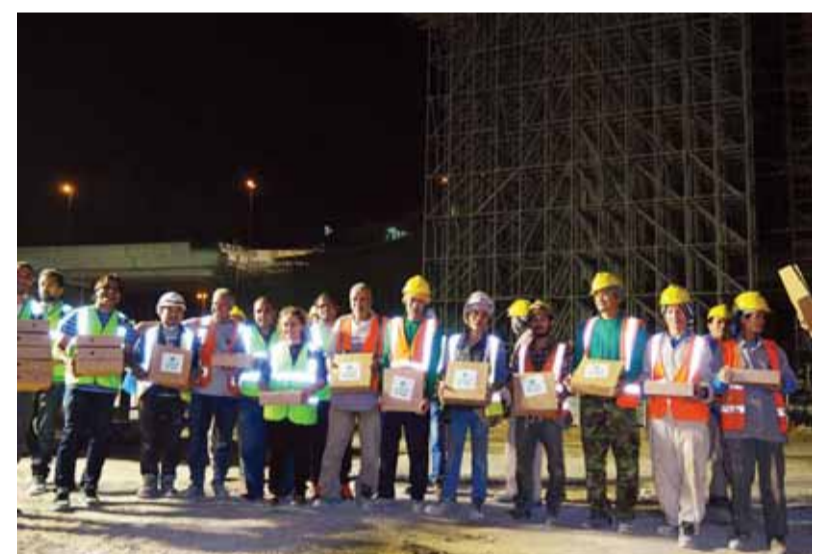
من حملة سحوركم علينا