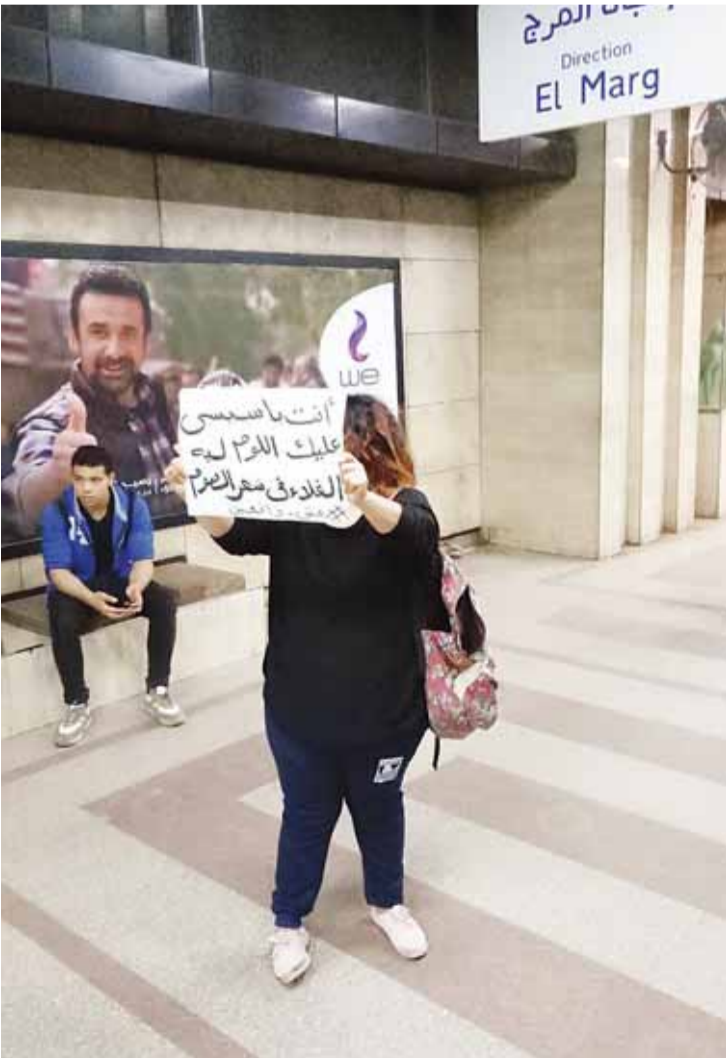
مصرية ترفع لافتة احتجاج في محطة السادات