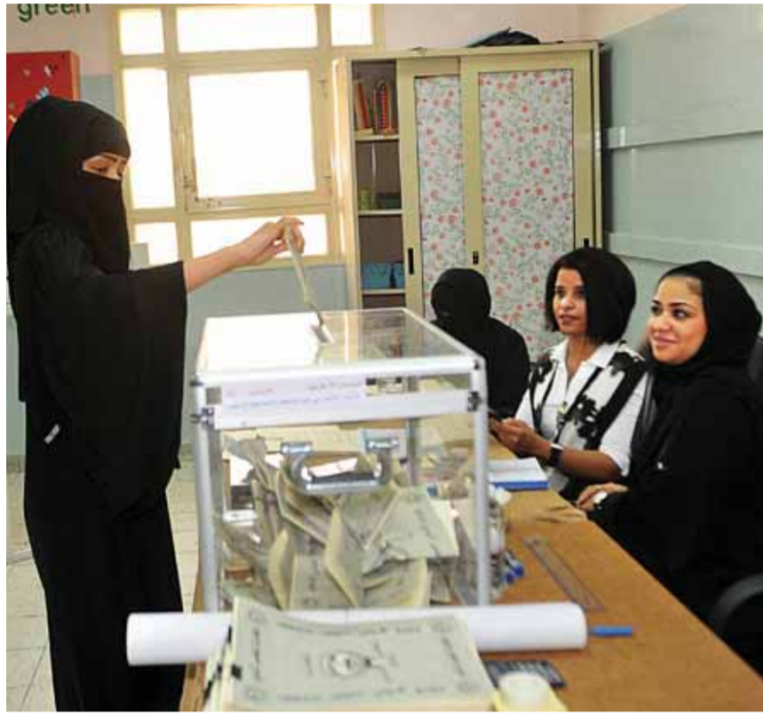
انتخابات البلدي في الدائرة السادسة

الأمير يشيد بجهود الجهات الحكومية في الانتخابات