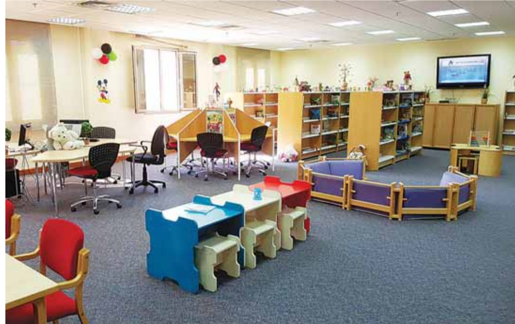
المكتبات العامة في حاجة إلى تطوير وظيفتها