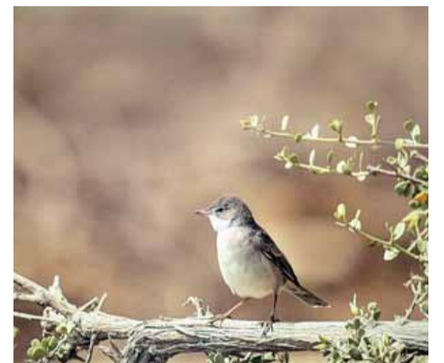
.. وأخرى معبرة عن أهمية الحفاظ على البيئة