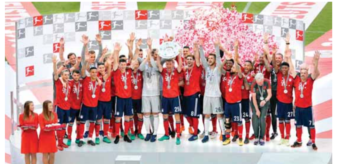
لاعب بايرن يحتفلون بلقب الدوري