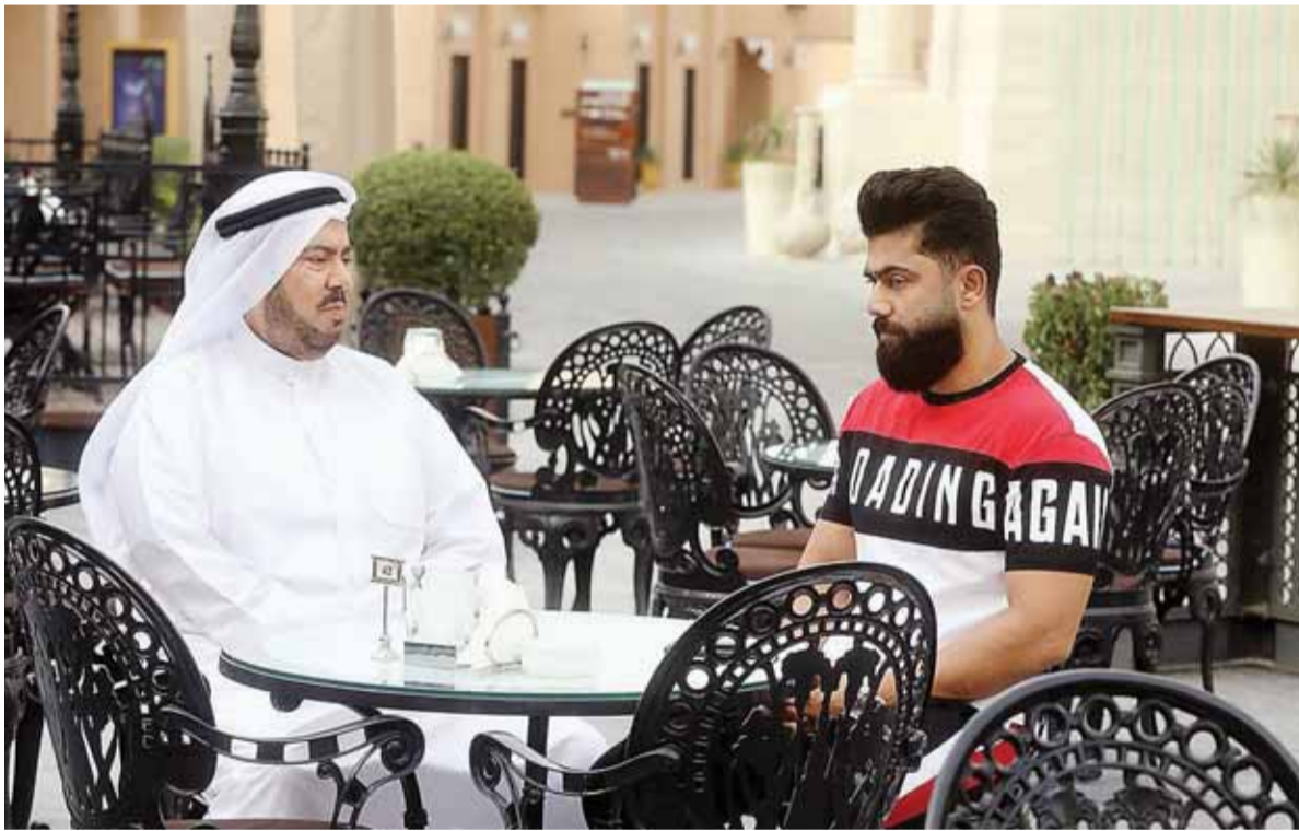
المسلم وبو صخر في مشهد من مسلسل «الجسر»