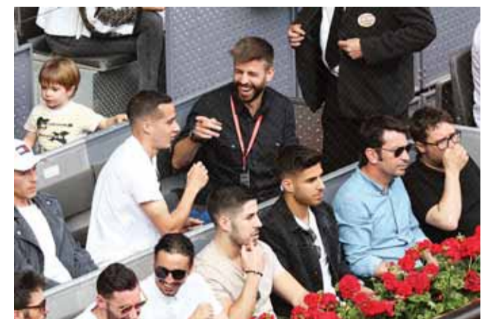
بيكيه يمارح فاسكينز خلال اللقاء

وفشل العلق الجذب أفريقي (31 عاماً و2.03 م) 10 مرات في تخطي الدور ربيع النهائي، وكان آخرها هذا العام في دورتي إنديان ويلز وميامي الأميركيين. ولدى السيدات، وأصلت الهولندية كيكي برتيز نجاحاتها وبلغت المباراة النهائية لدورة مدريد، بفوزها على الفرنسية كارولين غارسيا المصنفة سابعة في العالم 6 - 2 و 6 - 2 في أكثر من ساعة بقليل. (مدريد - أ ف ب)