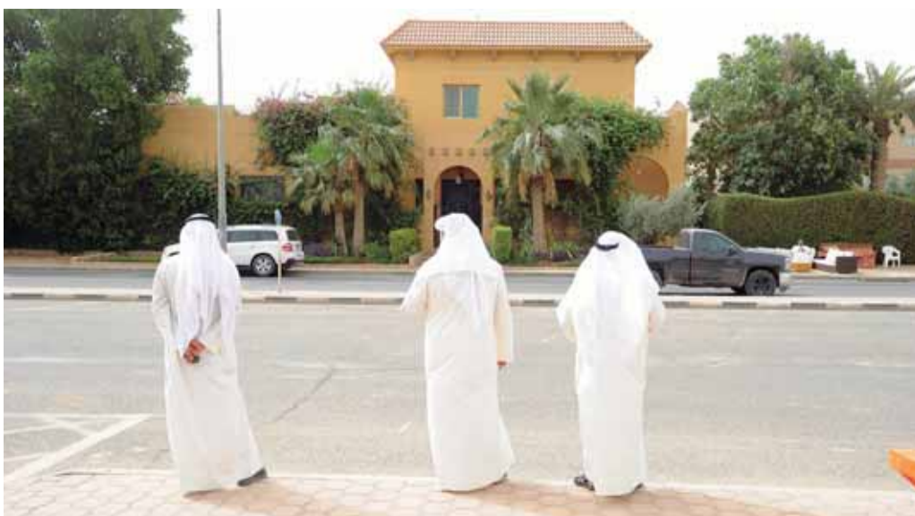
شوارع الثالثة خالية