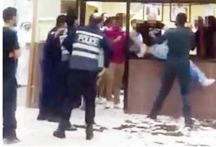
المشاجرات إلى متى؟

واوضح المصدر أن هذه المشاجرات أسفرت عن إصابة نحو 500 شخص، بعضهم أصيب بعاهات مستديمة، فيما صنفت 1100 مشاجرة على أنها جنحة، إضافة إلى 400 جنائية. وأضاف ان انتشار أدوات العنف وسهولة الحصول عليها ساهما