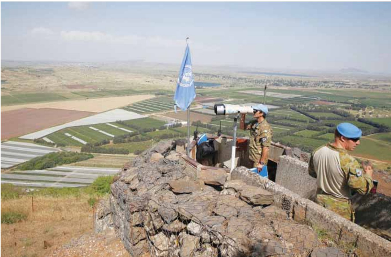
عناصر من قوات الامم المتحدة يراقبون منطقة الجولان عند خط وقف النار بين سوريا والجزء الذي تحتله اسرائيل

وقال متحدث إن ظريف سيزور على التوالي بكين وموسكو، وبروكسل مقر الاتحاد الأوروبي، لإجراء محادثات حول الاتفاق النووي. وانتقد الوزير «الإدارة المتطرفة» للرئيس دونالد ترامب، التي انسحبت من «اتفاق اعتبره المجتمع الدولي انتصاراً للدبلوماسية». ونيه إلى أن إيران مستعدة لاستئناف تخصيب اليورانيوم «على المستوى الصناعي من دون أي قيود». (الغاب)