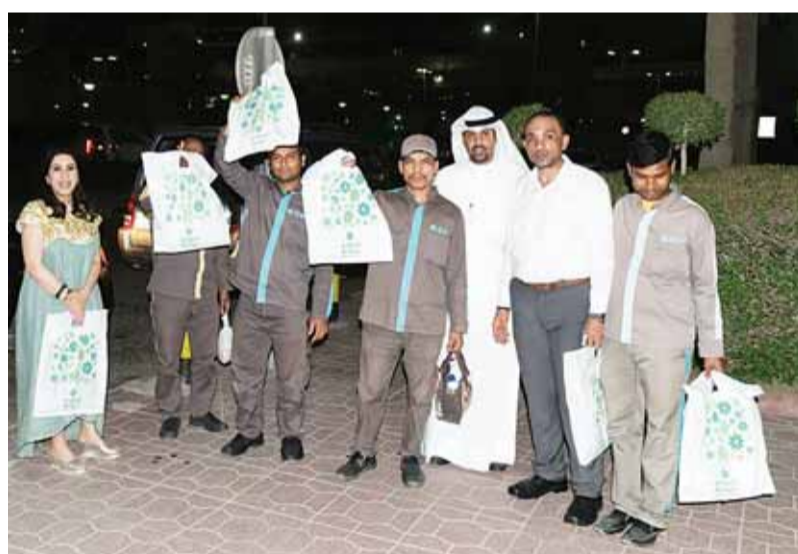
توزيع هدية العيد على العمال