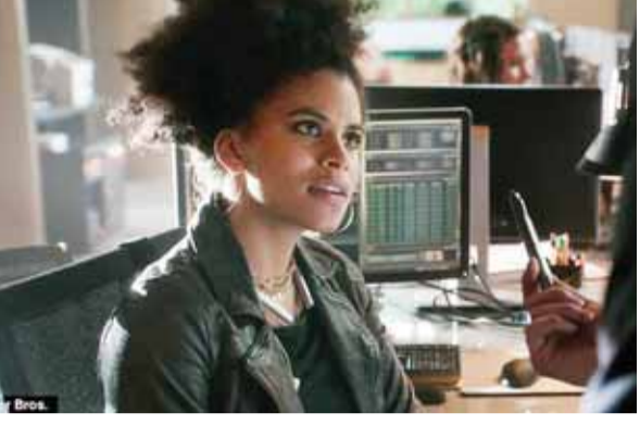
زاري بيتز في مشهد من الفيلم

تلعب الممثلة الألمانية زاري بيتز بطولة فيلم «ديبول 2»، ويجمع الفيلم بين الخيال العلمي والفتازيا، ويتناول أحداثا حول مدينة ديبول المبنية على قصص مارفل كومكس بعد أن تم إنتاج الجزء الأول من «ديبول» في سنة 2016، وهو من إخراج ديفيد ليتش، ويشارك في بطولة الفيلم راين رينولدز ومورينا باكارين وتي جاي ميلر وليزلي أوغامس وجوش برولين وبريانا هيلبراند، وقد بدأ عرض الفيلم في ألمانيا أول من أمس، ومن المقرر عرضه في عدد من دول أوروبا والولايات المتحدة الأمريكية لاحقا. (رويتز)