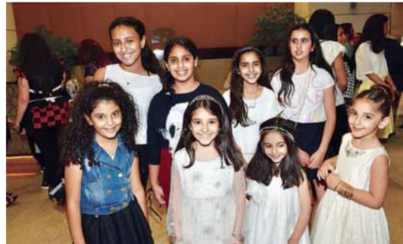
عدد من البراعم الصغيرة للفرقة

العشر الأخيرة، خصوصاً من قبل الأجيال الجديدة، مشيرة إلى أنها لمست شخصياً اهتمام وحرص العديد من الأهالي والأسر على تعليم أبنائهم وبناتهم العزف على البيانو وبعض الآلات الموسيقية الأخرى،