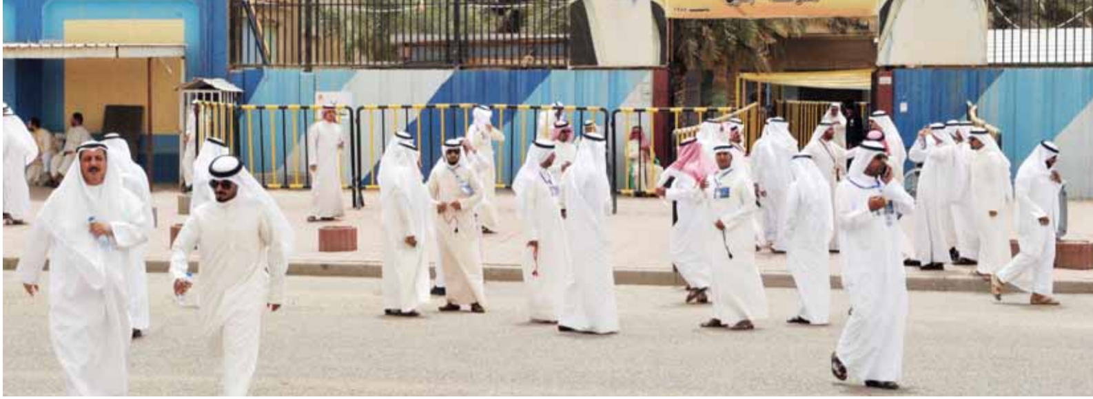
توافد خارج المدرسة لتصوير سيد سليم

شهدت غالبية اللجان الانتخابية مغادرة الرئيس والجلوس في اقسام خصصت لاعضاء السلطة القضائية مع ابقاء عدد من العاملين داخل اللجنة خلال غياب المقترعين.