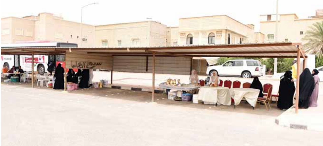
استراحة تحت المظلات

وحتى الساعة 12 ظهرًا لم يكن هناك إقبال على لجان الاقتراع، وخلال وجود القهيس في أحد أكبر مقار الدائرة التاسعة (ضاحية صباح السالم)، وصلت نسبة الاقتراع في إحدى اللجان الفرعية في مدرسة عبدالوهاب