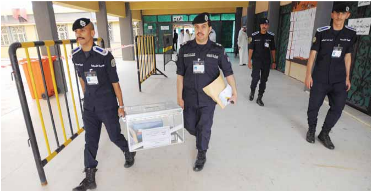
وصول الصناديق إلى مقار الاقتراع

كان القضاة ووكلاء النيابة في اللجان الانتخابية يدقون بشكل رسمي على جنسية المواطنين، ومن ثم يسمحون للناخب بالتصويت.