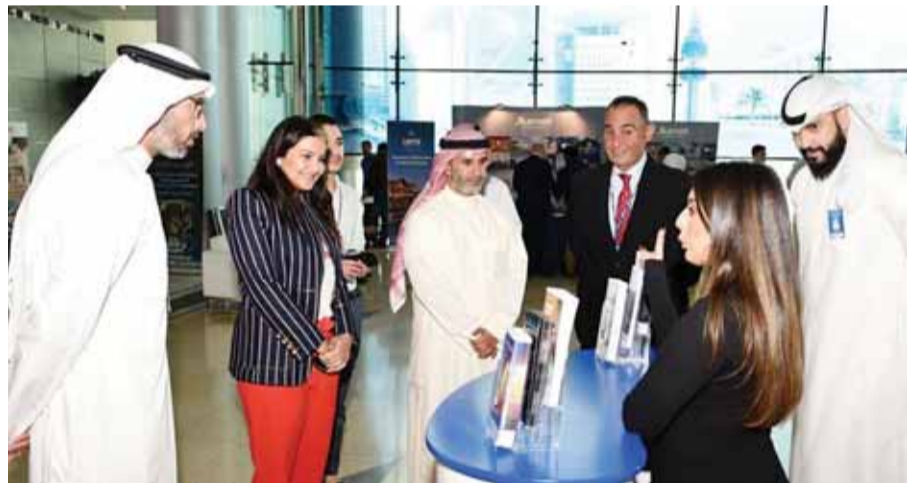
جانب من زيارة مسؤولي مؤسسة البترول لجناب «برقان»

مجاناً مدى الحياة، ودفتر شيكات مجاناً مدى الحياة (10 صفحات)، وغيره من المميزات الحصرية خصيصاً لموظفي هذا القطاع الحيوي. هذا وقد لاقى الكرنفال العديد من الإشادة والترحيب، حيث كانت فرصة لموظفي بنك برقان للتفاعل مع موظفي القطاع النفطي وشرح مميزات الباقة التي يقدمها البنك لهم.