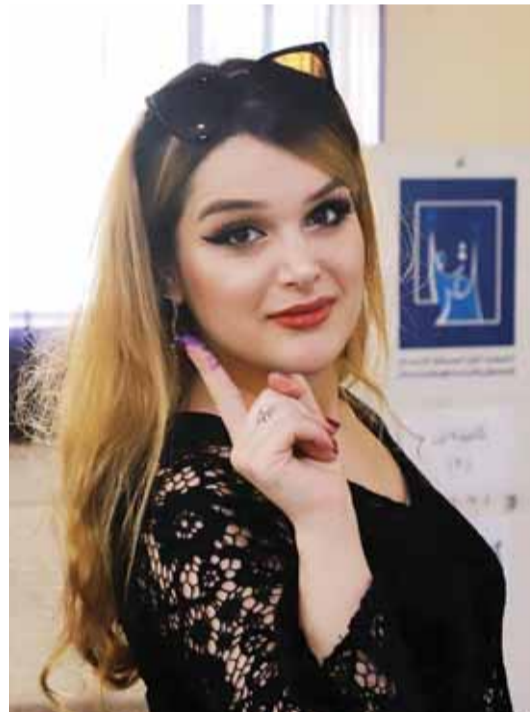
مشاركة نسائية