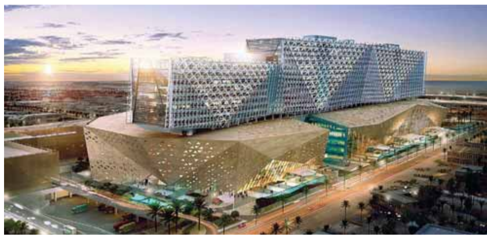
نموذج مشروع مستشفى الأطفال الجديد