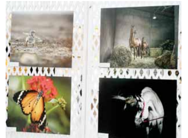
لوحات عن الطبيعة