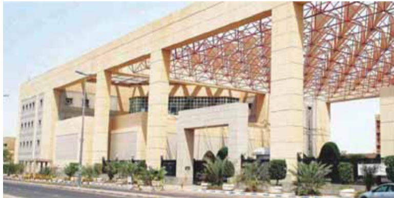
إدارة الجامعة | الرشيدية