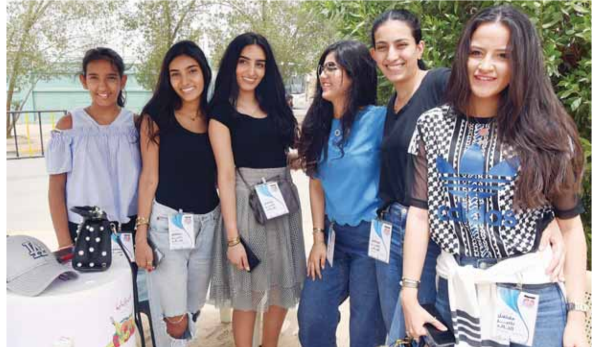
مؤيدات مهلهل الخالد