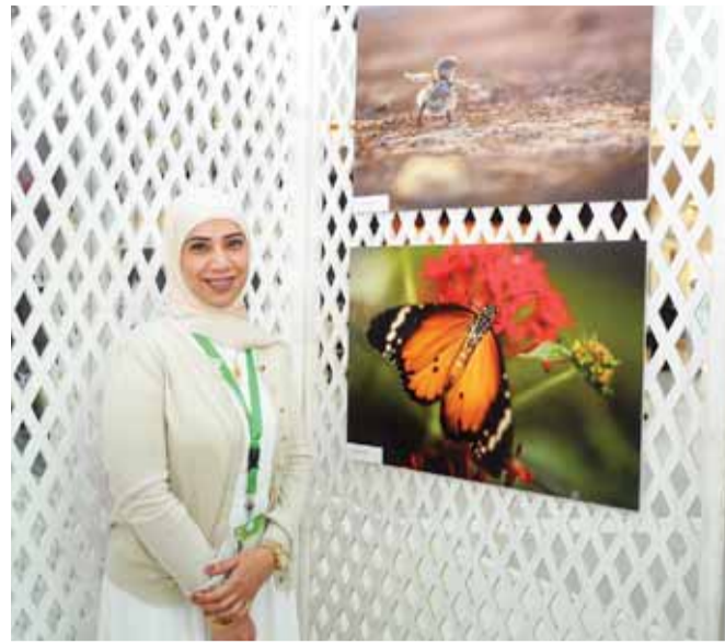
لطيفة اليوسف