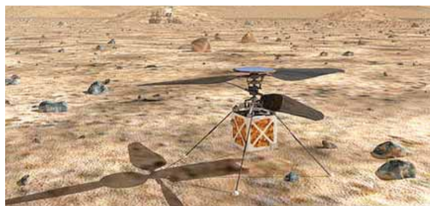
روبوت مهمته درس امكان العيش على المريخ