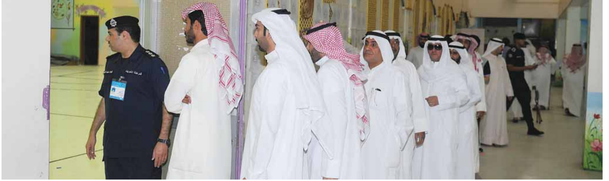
انتظار التصويت

أكد العديد من المناديب أن سبب غياب المقترعين في هذه الفترة هو الغبار وحرارة الجو، مرددين بالقول «ويك إند» و«النوم سلطان»، وأن الناخبين سيحضرون بعد العصر.