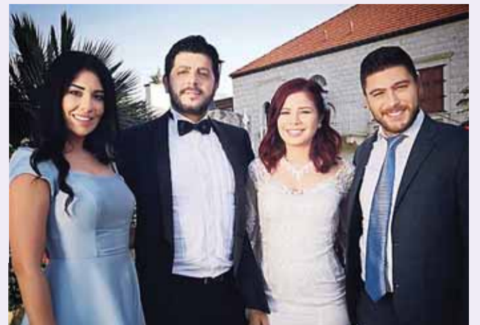
من مسلسل «الحب جنون»