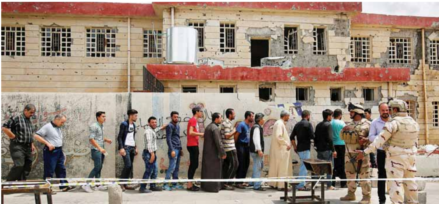
طابور ناخبين في الموصل أ ف ب

أما بالنسبة إلى السنة الذين يترشحون إلى الانتخابات من خلال أربع لوائح، فلا فرصة لديهم للعودة إلى السلطة التي سيطروا عليها قبل سقوط نظام صدام حسين عام 2003، بل يُفترض أن يلعبوا دوراً مسانداً في تشكيل الحكومة. (رويترز، أ ف ب، الأناضول، السومرية، نيوز)