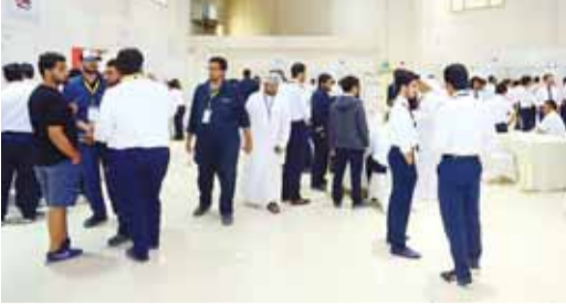
معرض كلية تكنولوجيا الطيران

اختتمت كلية تكنولوجيا الطيران معرض الفرص الوظيفية الأول، الذي نظّمته الكلية في مقرها بمنطقة ابوحليفة، لتعريف طلبتها بفرص العمل المتوافرة في جهات كثيرة. وقال عضو مجلس أمناء الكلية الكاتب طيار سعود الهزاع، إن المعرض جاء ضمن المسؤولية الاجتماعية لـ «تكنولوجيا الطيران» التي تمثل كلية AST في المملكة المتحدة، وهي من الكليات ذات السمعة العالمية في مجال الطيران.