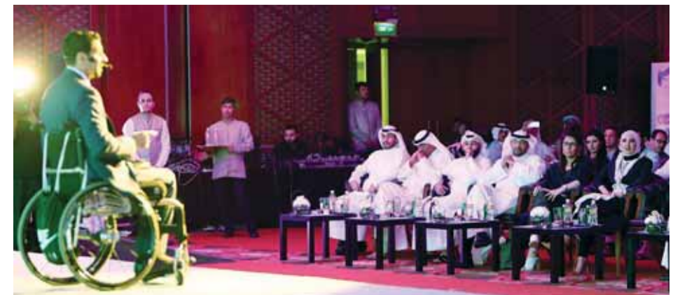
من فعاليات البرنامج

أعلن البنك الأهلي المتحد أمس عن رعايته برنامج هوف تو إمبروف الذي أقيم مؤخراً في فندق جميرا، وذلك تحت رعاية وزير الدولة لشؤون الشباب خالد الروضان. هذا، ويهدف البرنامج، الذي يعكس إستراتيجية البنك للمسؤولية الاجتماعية وحرصه الدائم على التواصل مع شتى فئات النسيج الوطني، بالدمج الاجتماعي مختلف الفئات في المجتمع، وذلك من خلال تسليط الضوء حول أبرز إنجازات الموهوبين من ذوي الاحتياجات الخاصة وتكريمهم بوسام تشجيعي، كأبطال موهوبين في مختلف مجالات إنجازهم. ويشارك في البرنامج بنسخته الحالية أكثر من 750 شاباً وفئة من الكويت ودول مجلس التعاون الخليجي، حيث يتضمن البرنامج فعاليات متنوعة تنموية مخصصة بدمج ذوي الاحتياجات الخاصة