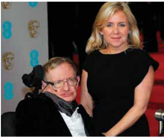
ستيفن هوكينغ وابنته

دعت عائلة عالم الفيزياء البريطاني الشهير ستيفن هوكينغ الجمهور إلى حضور مراسم تأبينه، حيث سيكون على موعد مع المستقبل، وهو أحد الأمور التي أثار فضوله خلال حياته الفريدة. وتوفي هوكينغ، أشهر عالم في العالم، في مارس عن 76 عاماً. وشملت أبحاث هوكينغ موضوعات عديدة، بدءاً من أصل الكون، وحتى احتمال الانتقال عبر الزمن إلى الغموض الذي يكتنف الثقوب السوداء في الفضاء.