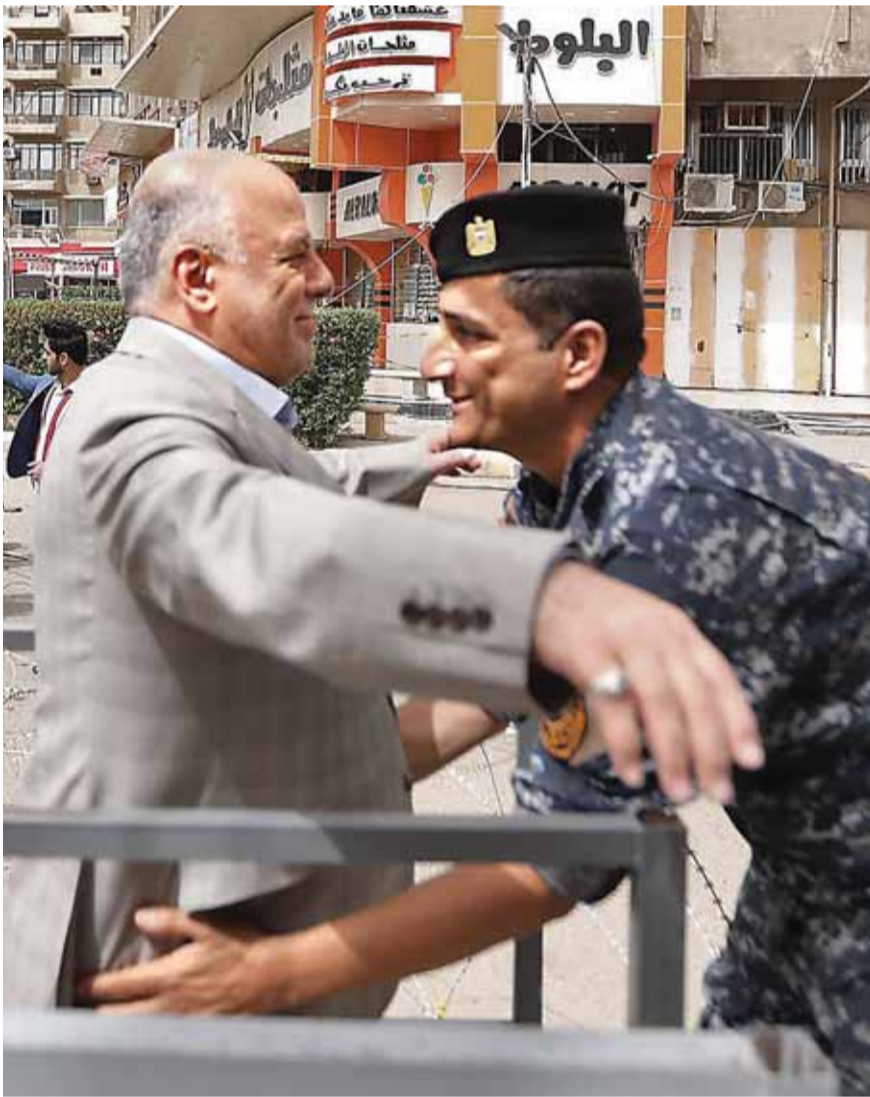
شريطي عراقي يفتش العبادي قبل اقتراعه في منطقة الكرادة في بغداد امس | الف ب

وأفقلت صناديق الاقتراع، أمس، في أول انتخابات عراقية بعد القضاء على تنظيم داعش الإرهابي، على تقارب كبير قد تفرزه النتائج وعودة شخصيات قد تعرقل تشكيل الحكومة المقبلة. وكان الالف العراقيين حملوا منذ الصباح الباكر هواجسهم من الفساد والطائفية والإرهاب الذي يمثلته تنظيم داعش، وتوجهوا لاختيار نوابهم من 7 الاف مرشح ومرشحة، و320 حزبا وائتلافا، وفق نظام إلكتروني جديد، ضمن قانون نسبي على أساس قوائم مغلقة ومفتوحة. غير أن نسبة المصوتين كانت ضعيفة مقارنة بالسنوات الماضية. وتكررت مصادر مفاوضات الانتخابيات أنها بلغت 32 في المئة. وسجلت محافظتنا ديالى وميسان أعلى نسب المشاركة، ثم محافظتنا واسط والمثنى. وفي المقابل، أظهرت أرقام غير رسمية نسب مشاركة متدنية في محافظات أخرى، خصوصا في البصرة. أما الموصل فشهدت إقبالا ملحوظا من العائدين إلى مناطق في المدينة.