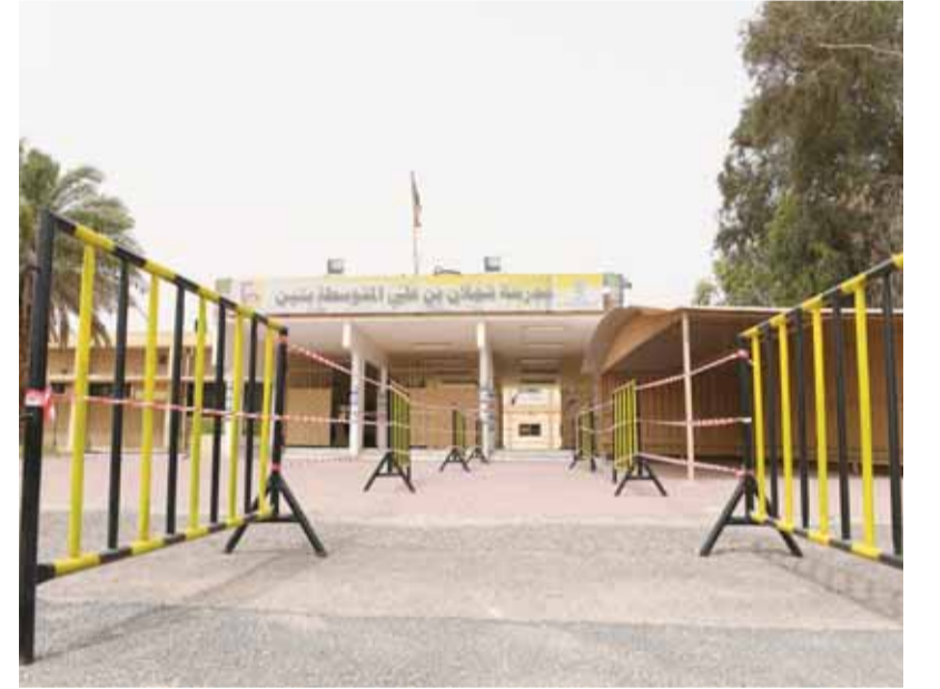
لا يوجد أحد