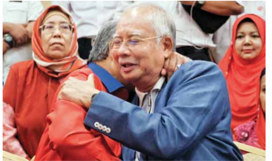
نجيب رزاق يعانق نائبه عقب مؤتمر صحفي له في كوالالمبور

تتجه ماليزيا نحو حقبة جديدة من الحكم، مع عودة الرجل القوي مهاتير محمد (92 عاماً) إلى رئاسة الوزراء، وأمس منعت وزارة الهجرة الماليزية رئيس الوزراء السابق نجيب رزاق من السفر، بعدما سرت تكتلات بانة على وشك الفرار عقب خسارته المفاجئة في الانتخابات، في محاولة يربح أنها لتجنب ملاحقته قضائياً على خلفية فضيحة مالية. وتجمع حشد غاضب في مطار كوالالمبور، حيث حاول منع السيارات من الدخول، بعدما أظهرت تذكرة سفر، تم تنسيبها عبر الإنترنت، أن نجيب وزوجته، التي لا تحظى بشعبية في البلاد، يتويمان المغادرة إلى إندونيسيا.