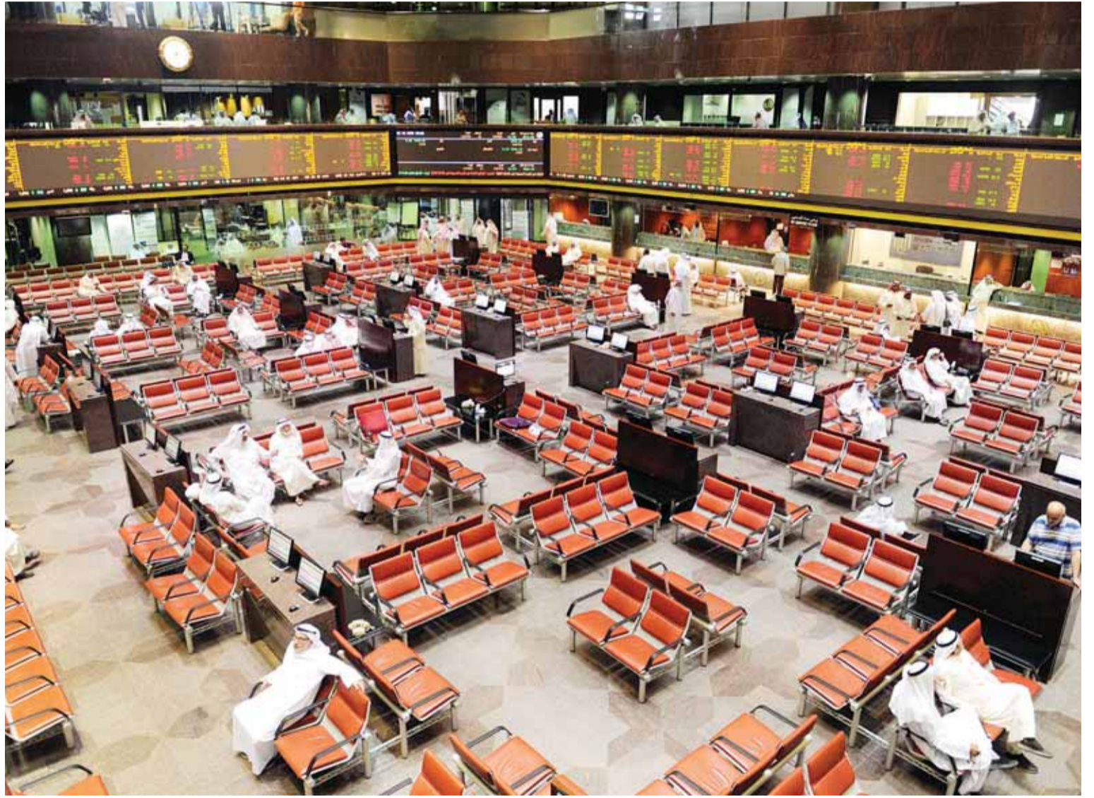
حسابات التداول النشطة في نهاية أبريل 3.7% من إجمالي الحسابات

حلل «الشال» التصنيف الائتماني الصادر عن وكالة «فيتش» وقال: أكدت وكالة «فيتش» للتصنيف الائتماني تصنيفها السيادي السابق للكويت (AA) مع نظرة مستقبلية مستقرة، والواقع أنها تعتقد بأن الكويت سوف تحقق فائضاً مالياً للسنة المالية 2017/2018 بحدود 900 مليون دينار كويتي، أو ما يعادل 2.4% من الناتج المحلي الإجمالي، ينخفض للسنة المالية 2018/2019 إلى نحو 300 مليون دينار كويتي أو نحو 0.7% من الناتج المحلي الإجمالي ومثله للسنة المالية 2019/2020. وتذكر «فيتش» بأن ذلك صحيح رغم خطورة استمرار الاعتماد الكبير للكويت على النفط، ورغم مخاطر الأحداث الجيوسياسية، ورغم ضعف الحوكمة وبيئة الأعمال في الكويت. وأضاف: التقرير جيد وصحيح، ولكنه جيد وصحيح لمن يرغب في التعامل مع الكويت، وتحديدًا لمن يرغب في إقراضها، وهو جيد للكويت؛ لأن تصنيفها الجيد يخفض تكلفة التمويل للدولة وللقطاع الخاص الكويتي عند لوجئها للاقتراض في السوق العالمية، ولكنه غير صحيح لو تم فهمه على أنه شهادة بسلامة الاقتصاد الكويتي، والتقرير ضمناً لا ينفي ذلك. والواقع أن التقرير يؤكد على أن وضع الكويت المالي جيد إلى درجة أنه يغطي على العيوب الجسيمة لوضع اقتصادها، مثل إدمانه شبه الكلي على النفط، ومثل ضعف حوكمته ورداءة بيئة أعماله، ومثل هيمنة قطاع حكومي مكلف على مقدراته. ذلك بلغة الاقتصاد يعني أن استدامة اقتصادها مكان شك، ولكن، وفقاً للتقرير، لا بأس لدائنيه والمتعاملين تجارياً معه من الاستمرار في تعاملاتهم، فعلى المدى المنظور، يستطيعون تحت أي سيناريو استعادة مستحققاتهم بسبب حجم مدخراته المجمعة في سنوات الوفرة النفطية.