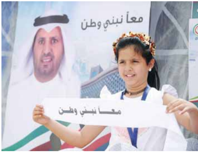
معاً نبني الوطن

وخلال جولة على اللجان الأصلية والفرعية في المدارس