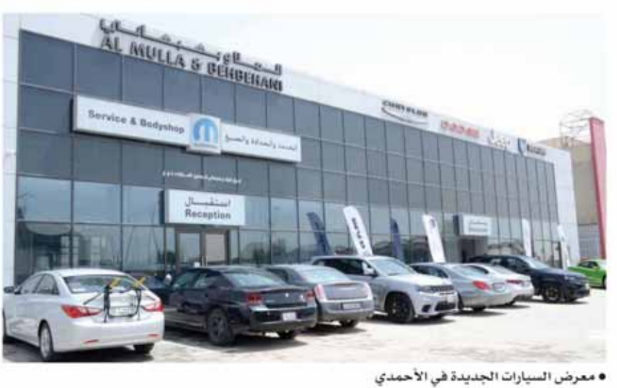
معرض السيارات الجديدة في الأحمدى

احتفلت شركة الملا وبهبهاني، الوكيل المعتمد للسيارات الفا روميو، كرايسلر، دوج، فيات، جيب، ورام، بالإضافة إلى خدمة وقطع غيار موبار واكسسواراتها في دولة الكويت بافتتاح المركز الجديد الأكثر تطوراً على مستوى وكلاء فيات كرايسلر في الشرق الأوسط وذلك بتاريخ 10/ مايو/ 2018. يضم المركز الجديد صالة عرض للسيارات الجديدة، مركز للإصلاحات العامة وآخر لبيع قطع الغيار، وللمرة الأولى، منطقة مخصصة للخدمة السريعة، بالإضافة إلى المنشأة الأكثر إثارة للإعجاب ألا وهي مركز الخداحة والصيغ. هناك ثلاثة دعائم أساسية لالتزام شركة الملا وبهبهاني من حيث تطوير تجربة العملاء على جميع المستويات: أشخاص مدربين جيداً، مناهج متطورة باستمرار ومرافق حديثة، الخطة الاستراتيجية الثلاثية التي تنتهجها الشركة تتمر عن نتائج منمثلة بالإضافة إلى تطوير مستويات الخدمة التي يمر بها العملاء، لقد بذلت جهود كبيرة في اعتماد تقنيات جديدة لدعم هذا التحول، هذا الاستثمار القوي لشركة الملا وبهبهاني في المرافق الجديدة يعتبر حيوي جداً، لأنه يعطي سعة إضافية مطلوبة بشدة لخدمة العملاء إلى جانب التطوير المستمر في التدريب والمناهج، ليس فقط بل وتجاوز هذه التوقعات، تم اختيار موقع المنشأة الجديدة والقرى من الجمعية الجديدة والمستوصف في الأحمدى للتعامل مع جميع جوانب خدمة العملاء من عملية الشراء إلى الصيانة الدورية والإصلاحات العامة بالإضافة إلى تطوير العلاقة بين شركة الملا وبهبهاني والعملاء الكرام من خلال قسم العلاقات العامة، تتميز هذه المنشأة الشاملة بصالة عرض خاصة بالسيارات الجديدة،