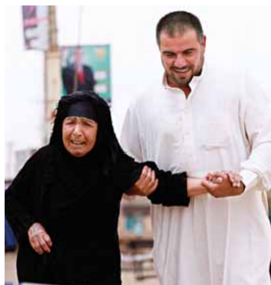
مشاركة من المسنّين