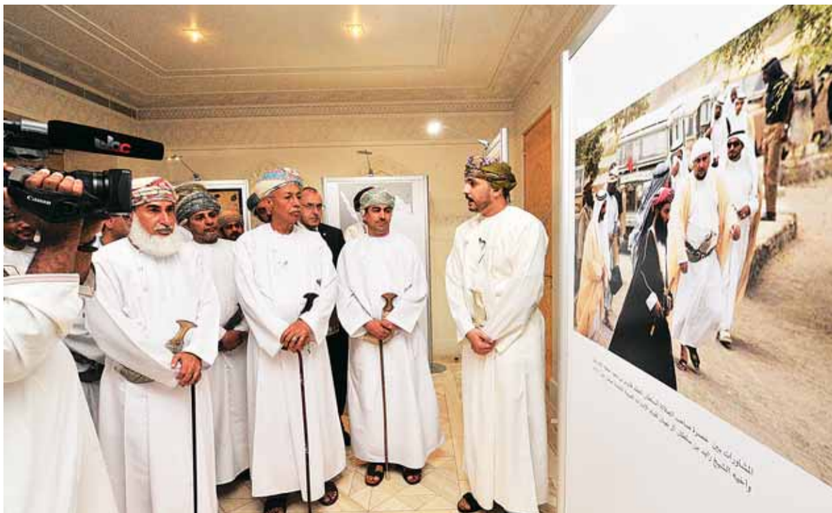
تضمنت الندوة عرضاً مصوراً للجوانب التاريخية ضمن فعالياتنا

ووفق مصادر اعلامية، تغلب كايو تشينغوني على منافسة من قائمة مختصرة قوية شملت محادثات سالي روني عن رواية «محادثات مع الأصدقاء»، وإميليو روسكوفيتش عن رواية «إيداهو»، غابرييل التنتس عن رواية «عزيزتي المطلقة» والمجموعة القصصية القصيرة للمرة الأولى للكاتبة كارمن ماريانا ماتشادو «جسدنا وحفلاتها الأخرى»، والروائية البريطانية جويندولين رابلي عن رواية «الحب الأول».