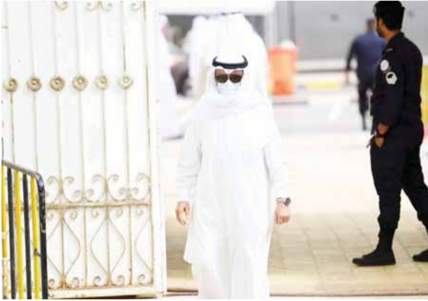
كمام يتصدى للاحوال الجوية