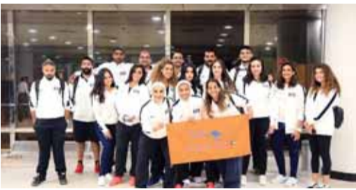
فريق الأسترالية المشارك في البطولة

شاركت الكلية الأسترالية في «بطولة الجامعات العالمية - يورو ميلانو 2018» في إيطاليا، التي شارك فيها نحو 2500 طالب جامعي من أوروبا وأفريقيا والشرق الأوسط وآسيا وأمريكا الشمالية والجنوبية، على مدى أربعة أيام. وكانت الكلية الأسترالية الجامعة الوحيدة المشاركة من الكويت، حيث مثلها فريق كرة السلة للرجال والسيدات، وفريق الكرة الطائرة للسيدات.