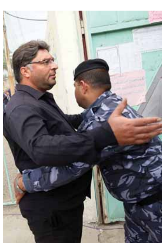
إجراءات أمنية