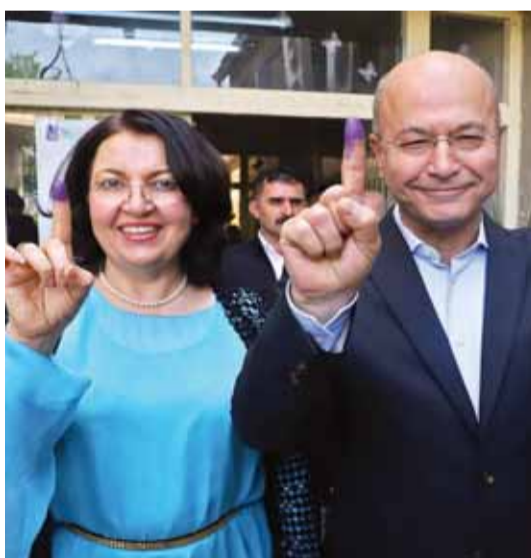
برهم صالح وزوجته بعد تصويتها في السليمانية