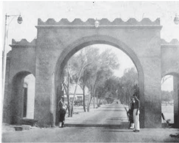
قصر دسمان في صورة تاريخية

قصر دسمان للبيع، وبالمراد العلني.. حكم قضائي نشرته الرميطة «الراي»، أعاد ذكريات هذا القصر التاريخي، الذي كتب عنه المؤرخ عبدالعزيز الرشيد، وبنائه الشيخ أحمد الجابر 1930 على انقاض قصر أبيه (1904)، وجهزه بكل ما يحتاج إليه من الأواني الذهبية والمفروشات النفيسة، في أعلاه مصباح كبير يهتدي به المسافرين ليلاً ويشاهد من نحو اثني عشر ميلاً، شُيّد على موقع مرتفع من الأرض في «بنيد القار»، يشرف المرء منه على منظرين بعيدين: البحر والبر. نظام القصر بدع؛ منظره يطرد الهم، وهوأوه طلق عليل، وجوه أصفى من عين الحمام.. تخترق السيارات إليه شارعاً طويلاً من الأثل صفت على جوانبه صفاً هندسياً بديعاً.