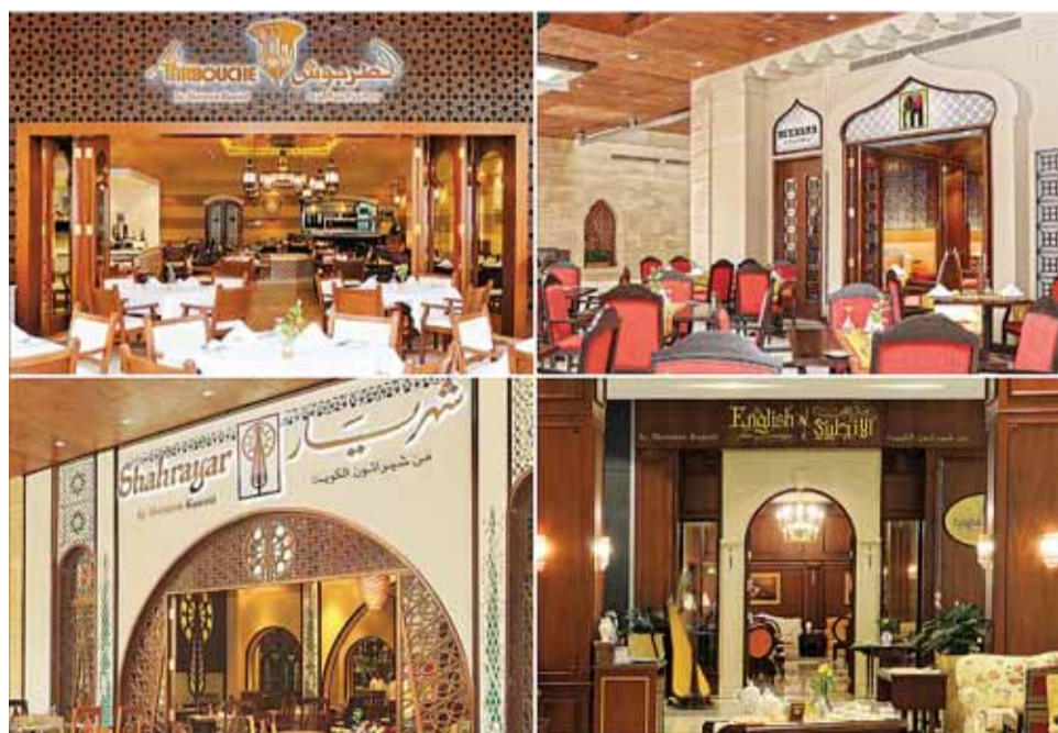
الأجواء الرمضانية العامرة بطابعها الخاص في شيراتون الكويت