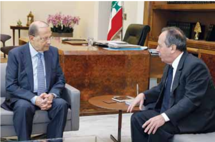
الرئيس ميشال عون مستقبلا النائب المنتخب جميل السيد | ألاتني ونهرا

وتقول مصادر مطلعة إن هذه الملفات كلها كانت حاضرة أمس في الاجتماعين اللذين ضمّا في قصر بعيدا رئيس الجمهورية العماد ميشال عون والرئيس الحريري، وفي عين التينة، الأخير والرئيس بري، حيث تمّ تفكيك بعض العقد التي يمكن أن تعترض طريق التاليف، ولقّحت المصادر إلى أن جلسة انتخاب رئيس المجلس ستُعقد على الأرجح في 23 مايو الجاري، وقد تمّ التوصل إلى اتفاق مبدئي على أن تؤول نيابة رئاسة مجلس النواب إلى النائب المنتخب إلياس بوصعب على اعتبار ان تكتل «لبنان القوي هو الأكثر تمثيلاً للارثوذكس». إضافة إلى شبه اتفاق على أن يكون البيان الوزاري للحكومة الجديدة شبيها ببيان الحكومة الحالية وبد«المحقق» الذي أضيف إليه لتاحية الناي بالنسف والتمزام للقرارات