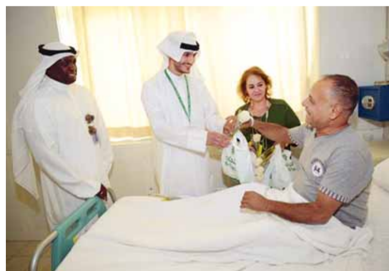
فريق العلاقات العامة بالبنك في زيارة المرضى لتعزيتهم بحلول الشهر الفضيل