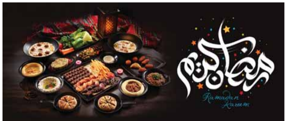
قائمة بشكل مختلف

والحلويات والمشروبات الرمضانية. الجدير بالذكر أن «ميس الغانم» الشرق يوفر ركن الصباح في مقهى السدور العلوي، وذلك في فترة الغبقة والسحور، مانحاً زبائنه الاستمتاع باختيارات عديدة. الاستعدادات نفسها في «ميس الغانم» المهبولة الكائن في مجمع سبوزن على الشريط الساحلي، حيث الأجزاء الرمضانية الدافئة مع الخدمات الاستثنائية. وبهذه المناسبة، توجه وليد لمطعم ميس الغانم أميرها ومواطنيها وجميع المهتمين على أرضها بمناسبة قرب حلول شهر رمضان المبارك، متمنياً أن يعم هذا الشهر على الجميع بالصحة والبركات، مؤكداً أن أبواب «ميس الغانم» مشرعة لاستقبال الزبائن للاحتفال باجواء رمضان أصيلة وعائلية لا تُنسى.