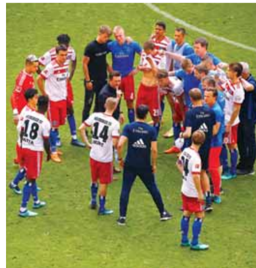
لاعب هامبورغ يواسي بعضهم بعضاً بعد الهبوط

وستكون المباراة الأخيرة في الدوري الإنجليزي فرصة لنجم ليفربول المصري محمد صلاح، لضمان صدارته لترتيب الهدافين هذا الموسم، إذ يتصدر برصيد 31 هدفاً، بفارق ثلاثة أهداف عن لاعب توتنهام هاري كين.