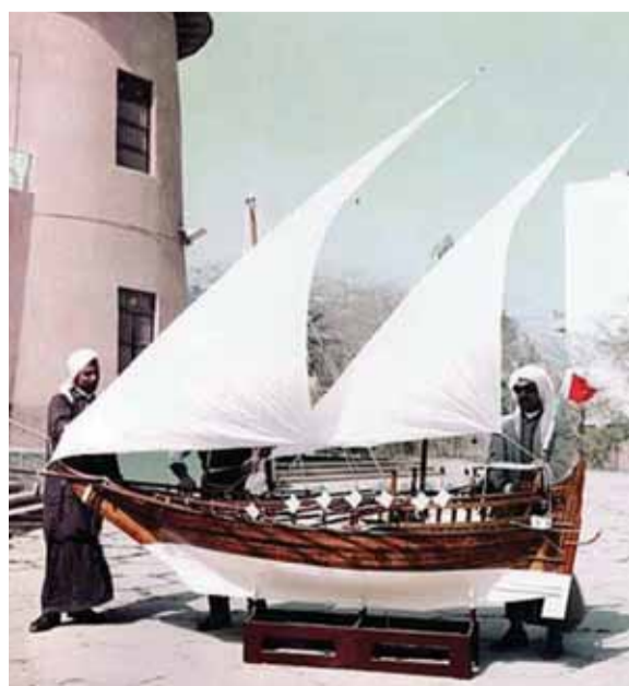
المتحف الوطني 1965

متحف لآثار شعبية في فيلكا، إلى جانب أعداد متحف آخر لآثار القديمة يعتبر من أجمل المناطق، والتي يبلغ عدد الأشجار التي غرست هناك أكثر من 900 شجرة.