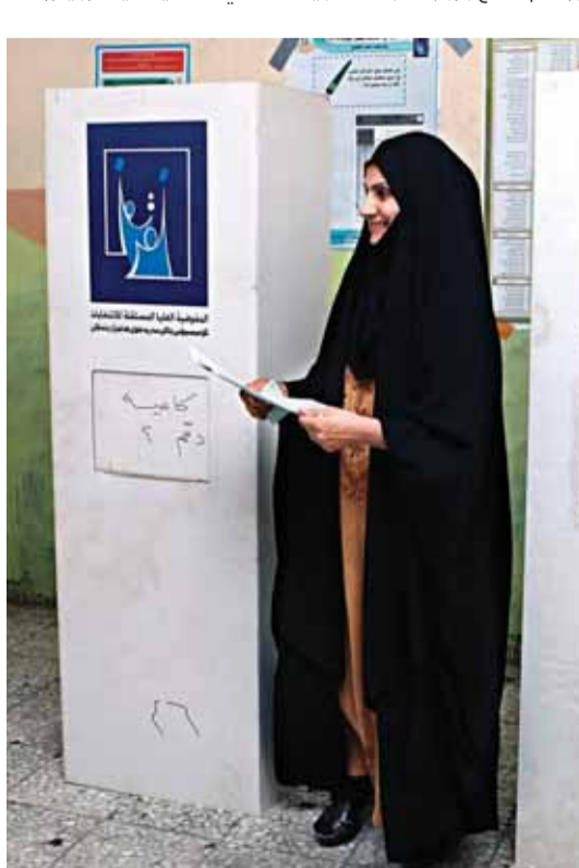
إمرأة تصوّت قرب جهاز إلكتروني في البصرة