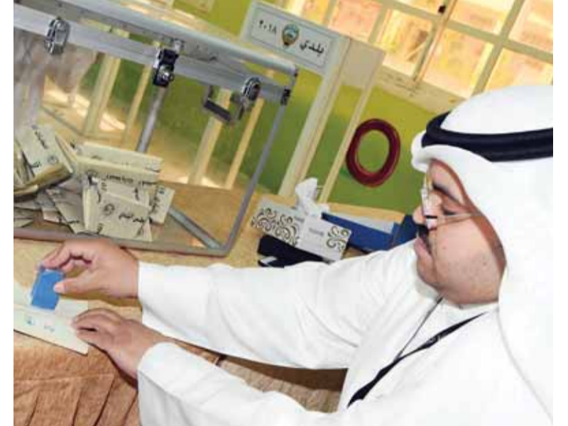
ختم الجنسية