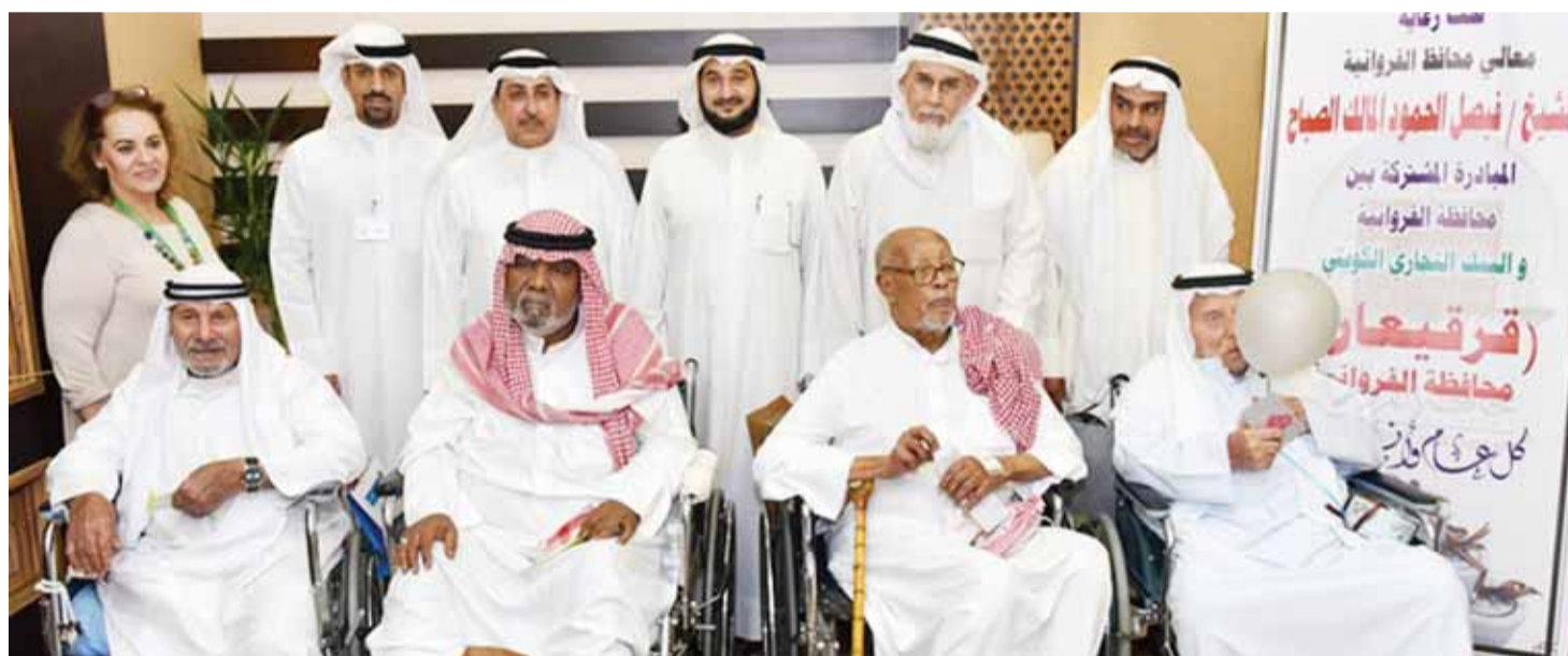
من فعاليات قرقيعان محافظة الفروانية العام الماضي

تقديم الدعم والرعاية لبعض الأنشطة الاجتماعية والخيرية والإنسانية والفعاليات الأخرى التي تنظمها محافظات الكويت