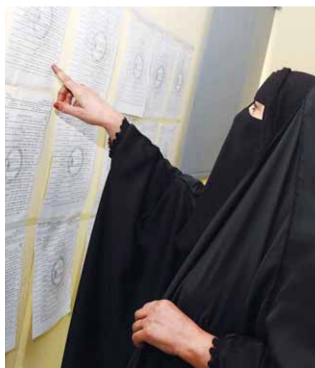
تبحث عن قيدها