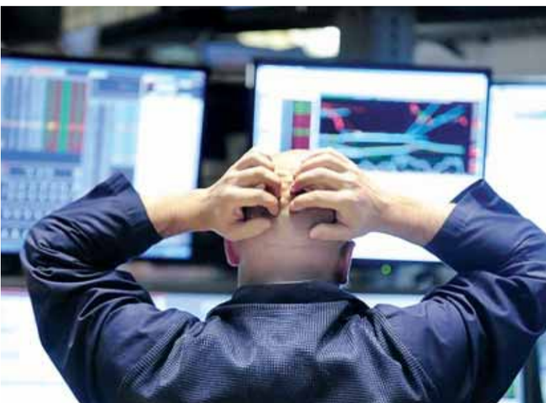
محللون يؤكدون تخمية نشوء أزمة جديدة.. لكنهم يختلفون في تحديد موعدھا إنترنت

قد تنفجر في العام الحالي أو الذي يليه، لكنها تبدو محتمة. وأن بعض دلائلها بدأت في الظهور، حيث يقول مات كينج المخطط الاستراتيجي في مجموعة سيتي إن معدل الاستثمار الأجنبي في ديون الشركات الأميركية انخفض بنسبة 3.5% العام الحالي.