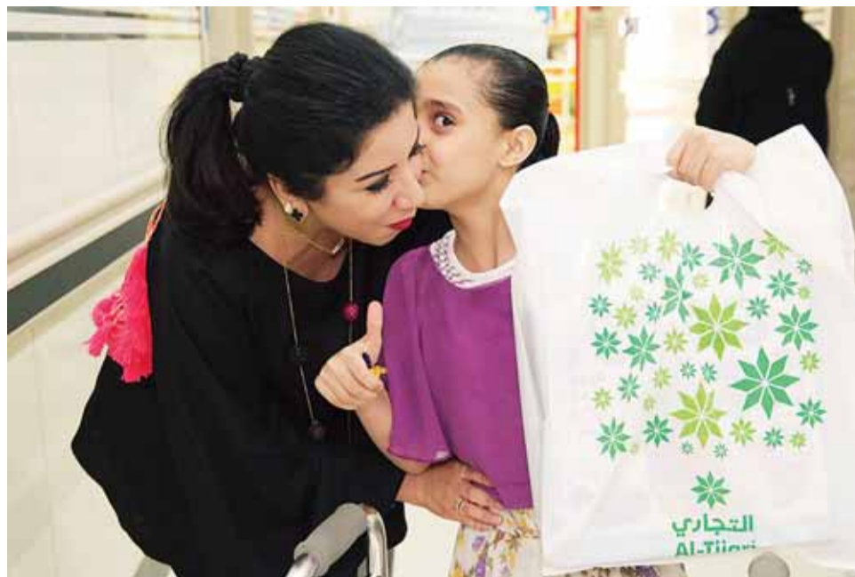
رسم البسمة على وجه طفلة