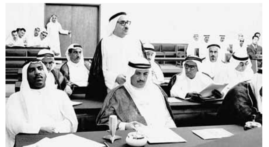
إحدى جلسات المجلس التأسيسي

خلال 52 أسبوعاً، وهي لمدة الدستورية، عقد المجلس التأسيسي 32 جلسة، فدرس 14 شكوى واقتراحاً، وأقر دستورا جديدا للبلاد، وكذلك 42 مشروع قانون. وكانت آخر جلسة تاريخية له عقدت بتاريخ 16 يناير 1963 واقتصرت على تبادل