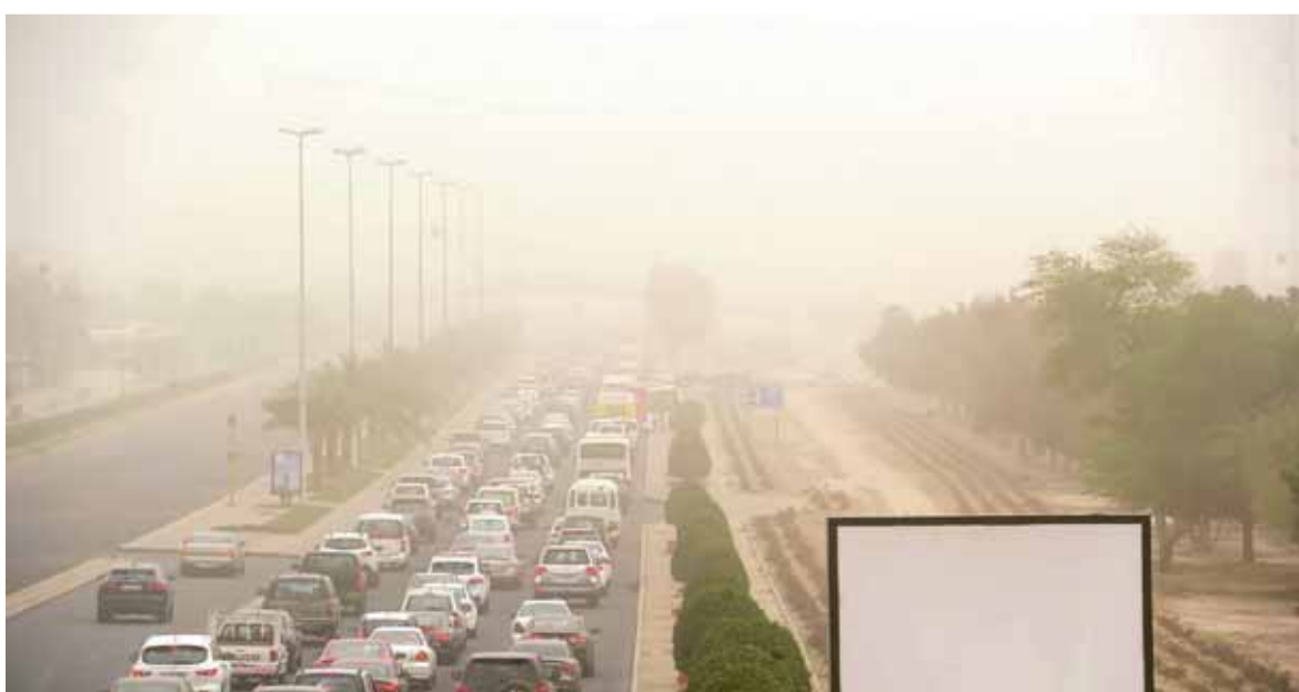
الغبار يخبّم.. والمطلوب تدابير احترازية

التيارات الهوائية، وهبوب رياح سطحية تحمل معها الأتربة والرمال الصاعدة.