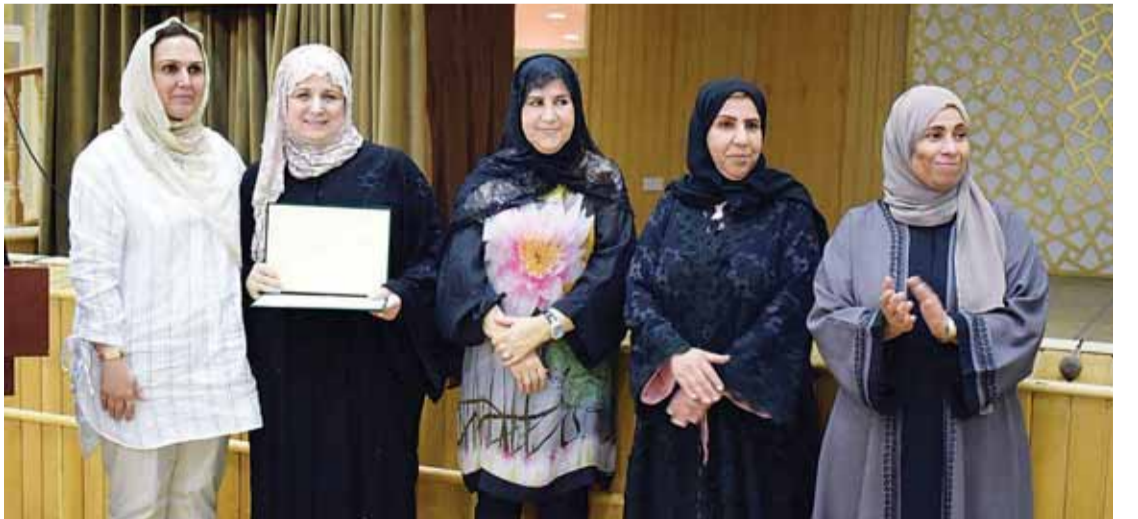
تكريم الفائزين في مسابقة القرآن الرجاء