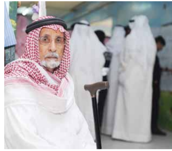
الأهولية لكبار السن