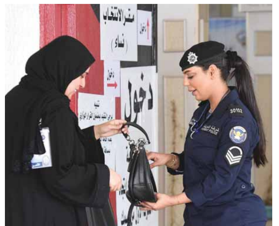
الشرطة النسائية حاضرة