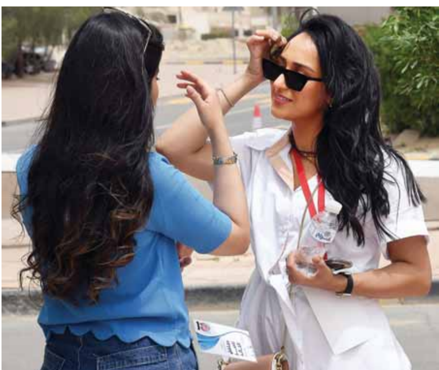
دعم نسائي لمرشحين