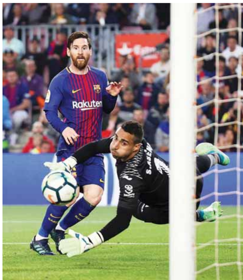
ميسي يسدد على مرمرى فياريال

الدينامية، لكني لا أدري سبب هذا التغيير الكبير الذي حصل. ما لدينا الآن هو السلوك المناسب والالتزام، وهذا كان المفاجئ (تحسن نتائج الفريق)».