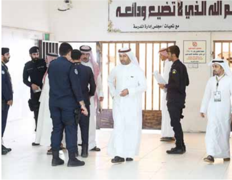
الشرطة أكثر من الناخبين