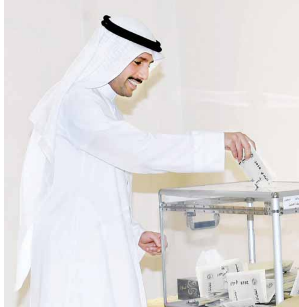
الغانم يضع ورقة التصويت في الصندوق

تميزت مقار التصويت الانتخابية بتوفير جميع التسهيلات الميدانية للمواطنين، حيث كان لافتاً تنظيم وزارة العدل وتجهيزها لكل لجان التصويت في مدارس وزارة التربية. كما كان لافتاً تواجد المعنيين الإداريين بوزارة العدل في مقار التصويت، وعلى رأسهم وكيل الوزارة عبداللطيف السريع، وكانت ردة فعل المواطنين بالشكر لتنظيم الوزارة.